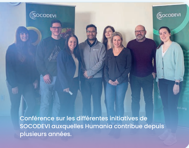
Conférence sur les différentes initiatives de SOCODEVI auxquelles Humania contribue depuis plusieurs années.

Nos bons résultats, combinés à notre solidité financière, nous permettent de continuer à innover en créant des solutions d'assurance sur mesure pour les générations d'aujourd'hui et celles de demain.