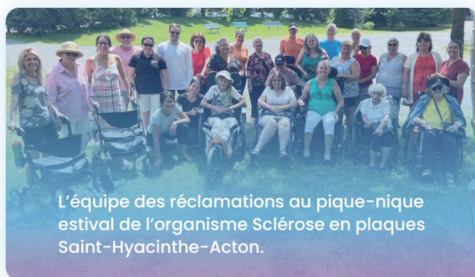
L'équipe des réclamations au pique-nique estival de l'organisme Sclérose en plaques Saint-Hyacinthe-Acton.