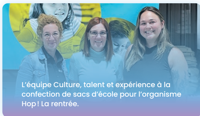
L'équipe Culture, talent et expérience à la confection de sacs d'école pour l'organisme Hop! La rentrée.

Nous sommes profondément touchés par le dévouement et l'engagement de nos collaborateurs. Leur profond respect des valeurs humaines est une source de fierté pour Humania et contribue à faire de notre entreprise un acteur positif dans la collectivité.