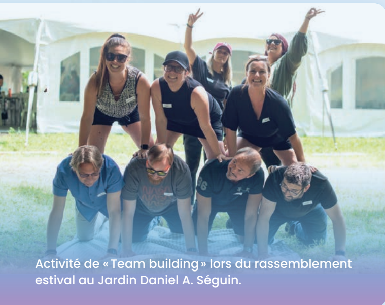
Activité de « Team building » lors du rassemblement estival au Jardin Daniel A. Séguin.

Humania a remporté le prix « 2023 Innovative HR Team », décerné par Human Resources Director Canada. Ce prix récompense les entreprises canadiennes qui se sont démarquées par leur gestion des ressources humaines au cours de l'année. Nous sommes fiers d'affirmer que nos talents sont au cœur de notre succès et que nos initiatives innovantes en matière de ressources humaines soient reconnues et célébrées.